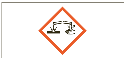
2 Le symbole de danger «corrosif» signale la présence d'un risque cutané important. Des mesures de protection de la peau, telles que le port d'équipements de protection appropriés (p. ex. gants), doivent être impérativement respectées.