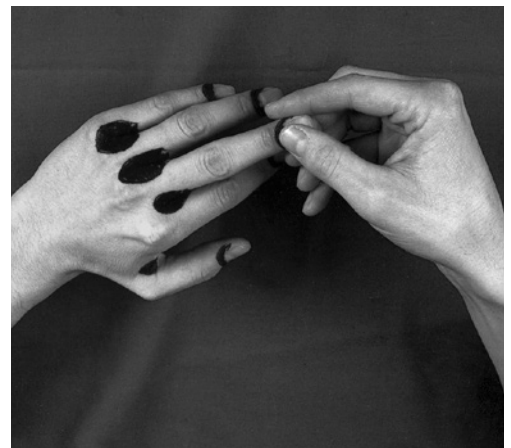
3 Il ne faut pas oublier d'appliquer une crème de soin et de protection entre les doigts.