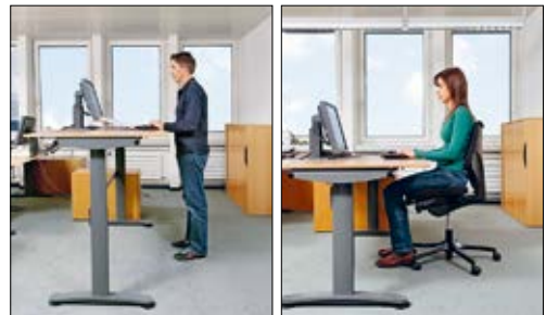
2 Ein Verstellbereich von 65 bis 125 cm gewährleistet, dass am Tisch sowohl kleine Personen sitzend als auch grosse Personen stehend arbeiten können.