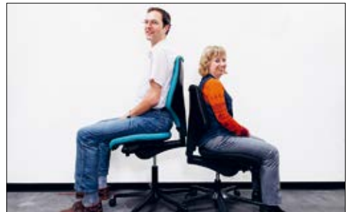
3 Für grosse Personen sind Standardstühle meistens ungeeignet. Viele Hersteller bieten ihre Stühle auch in einer Grossvariante an.