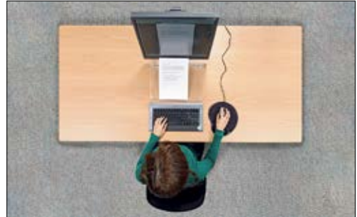
1 Der Bildschirmarbeitsplatz muss eine genügende Tiefe aufweisen, damit Tastatur, Bildschirm und Dokumente hintereinander Platz finden.