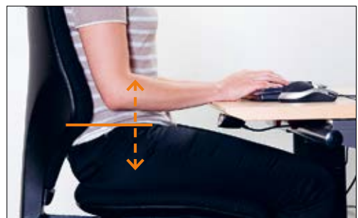
4 Die Höhenverstellung der Rückenlehne ermöglicht die genaue Positionierung des Lendenbäusches.