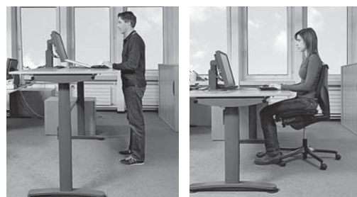
Fig. 2: table dotée d'une plage de réglage de 65 à 125 cm convenant aussi bien à une personne de petite taille travaillant assise qu'à une personne de grande taille travaillant debout.