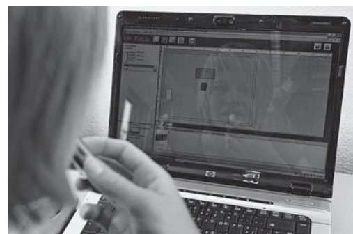
Fig. 7: les écrans brillants ne sont pas adaptés, car ils produisent des reflets désagréables.