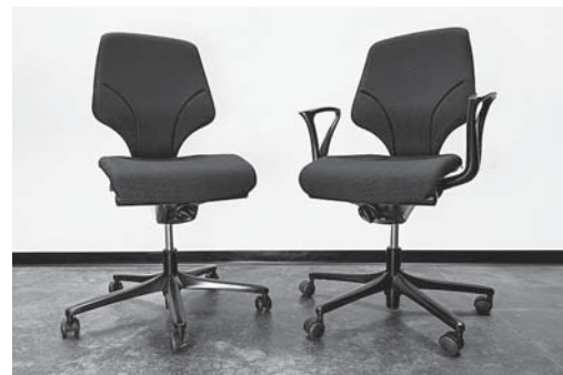
Fig. 5: les accoudoirs permettent aux personnes corpulentes ou souffrant de douleurs aux genoux de s'asseoir et de se lever plus facilement, mais n'ont pas d'utilité ergonomique.