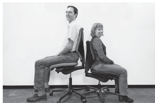
Fig. 3: les fauteuils standard sont généralement inadaptés aux personnes de grande taille. De nombreux fabricants proposent des modèles «grande taille».