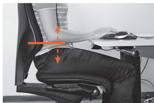
Fig. 4: le réglage de la hauteur du dossier permet de positionner correctement le support lombaire.