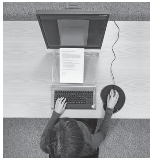
Fig.1: le plan de travail doit avoir une profondeur suffisante pour permettre de placer des documents entre le clavier et l'écran.